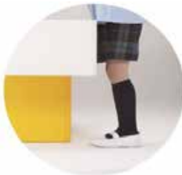
つまずきにくい キャンチ構造を採用した。こどもたちが つまずきにくい安心設計です。