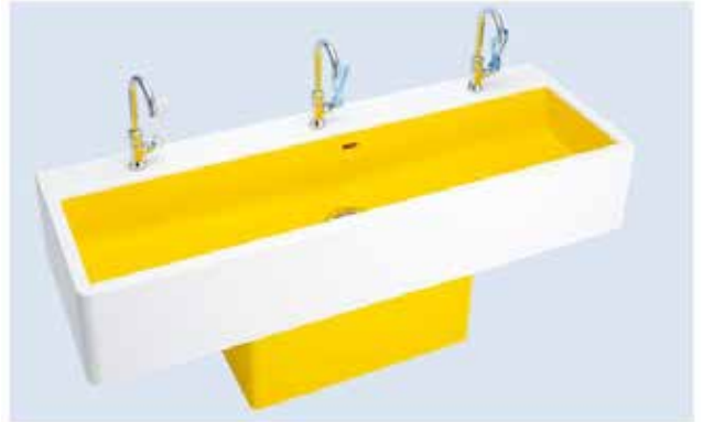
給水・排水設備を包み、機能もデザインもシンプルさに こだわったフレキシブルシンク専用架台付き。つまずき にくい安心設計です。